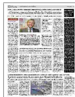
Codice abbonamento: 072896